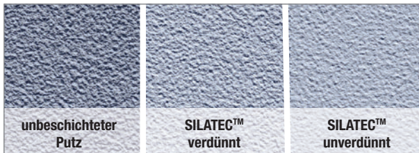
Vergleich unbeschichteter Putz und bei Einsatz von Silatec

Dank dieser Technologie ist Herbol Silatec eine gut füllende Beschichtung mit sehr guter Kuppen- und Kantenabdeckung. Zudem kann die Fassadenfarbe für ein strukturerhaltendes Beschichtungsergebnis auch verdünnt eingesetzt werden. In jedem Fall lässt sie sich leicht verarbeiten.