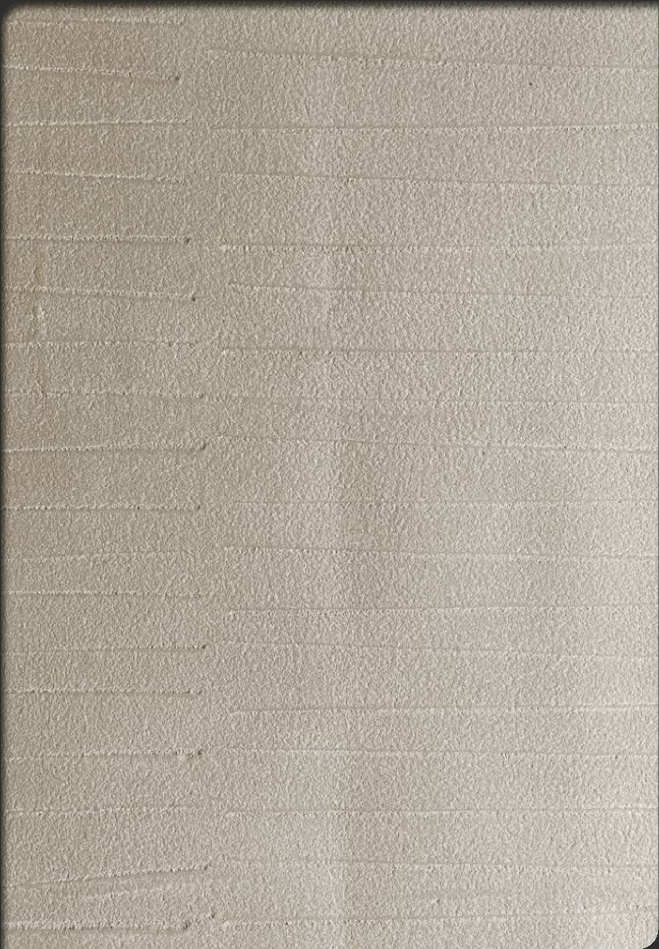
Urban Deco Inciso UD9